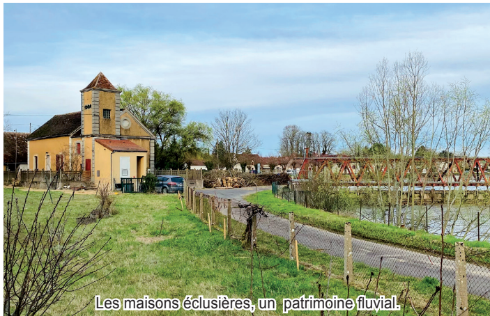
Les maisons éclésières, un patrimoine fluvial.

EN 1863, commençait à Courlon un vaste chantier qui allait s'échelonner sur six années : travaux du canal de dérivation, du pont le franchissant, de l'écluse, de la maison de l'éclusier, et du barrage. L'écluse n'était en fait qu'une écluse de garde pour éviter le trop-plein d'eau dans le canal.