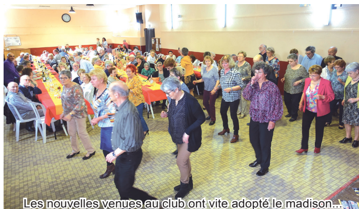
Les nouvelles venues au club ont vite adopté le madison...