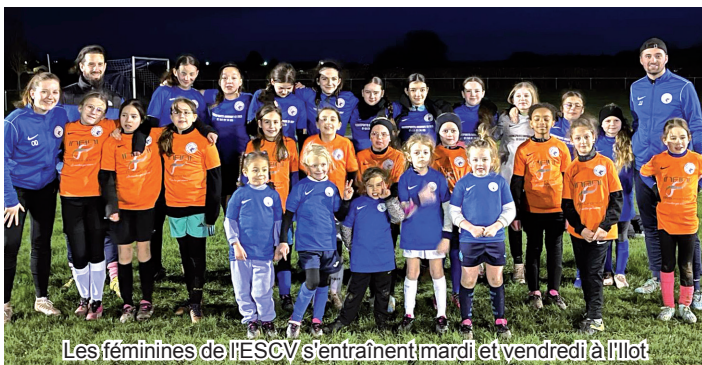
Les féminines de l'ESCV s'entraînent mardi et vendredi à l'Ilot

Dans l'optique de développer le football féminin dans le secteur nord de l'Yonne, il a été créé en septembre 2023 une section féminine au sein de l'Entente Vinneuf/Courlon. L'objectif était de recruter 10 à 15 filles et au final ce sont 35 filles licenciées qui ont adhéré au projet, des U6 aux U14 et U15 (de 6 à 15 ans). Ce qui classe le club, pour cette première année, dans le top 5 des clubs féminins de l'Yonne.