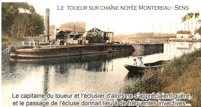
LE TOUEUR SUR CHAÎNE NOYÉE MONTEREAU - SENS