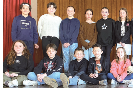
Les élèves de CM2 en répétition