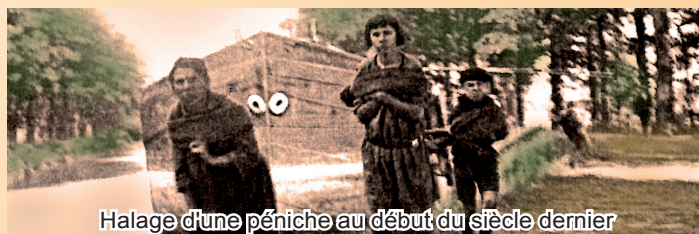
Halage d'une péniche au début du siècle dernier