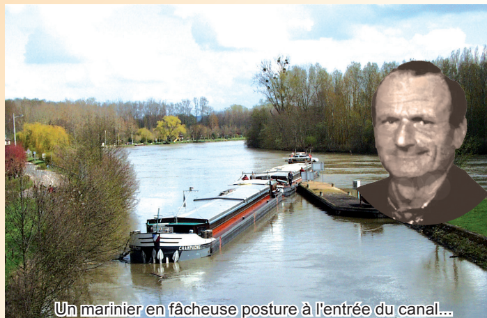
Un marinier en fâcheuse posture à l'entrée du canal...