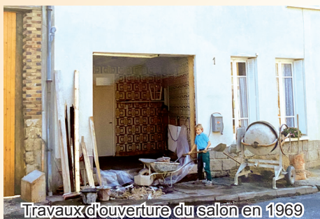
Travaux d'ouverture du salon en 1969

nouvellement acquise. Les travaux rondement menés, le salon accueillit une clientèle villageoise, mais également parisienne durant les vacances et les week-ends.